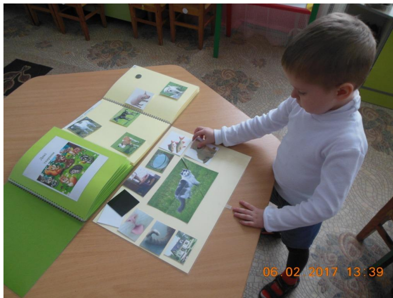
Фото 14. Процес роботи дитини з посібником

Для складання описової розповіді на початковому етапі дитина сама обирає тварину про яку буде розповідати, з кожної сторінки книжки дитина самостійно підбирає картки-підказки і викладає їх на ігровому полі навколо фото тварини, яку буде описувати.