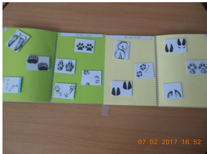
Фото 10. Розгортка 8 «Де чії сліди?».

Ускладнення: згрупувати сліди за схожим зовнішнім виглядом, яка ознака об'єднує таких тварин (мають копита, «м'які лапи» - мають ступні-подушечки)