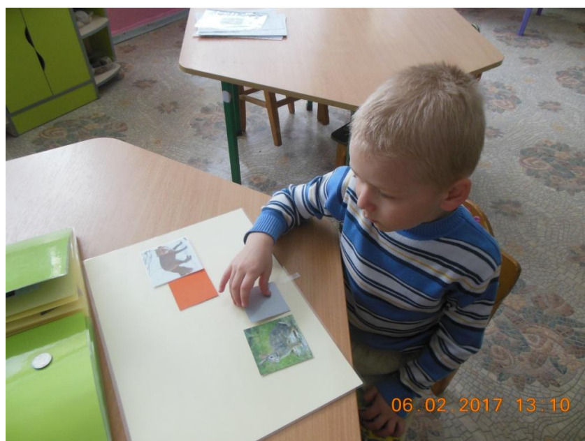
Фото 5. «Хто якого кольору?».

Як ускладнення , дитина має назвати тварин які змінюють колір хутра, розповісти чому вони це роблять (можна використати матеріали розгортки 7 «Поведінка тварин влітку і зимою»).