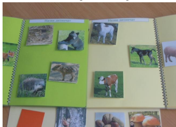
Фото 8. «Назви дитинчат».

Вправляти дітей в утворенні пестливих форм: кошеня - кошенятко, теля – телятко і т.д.