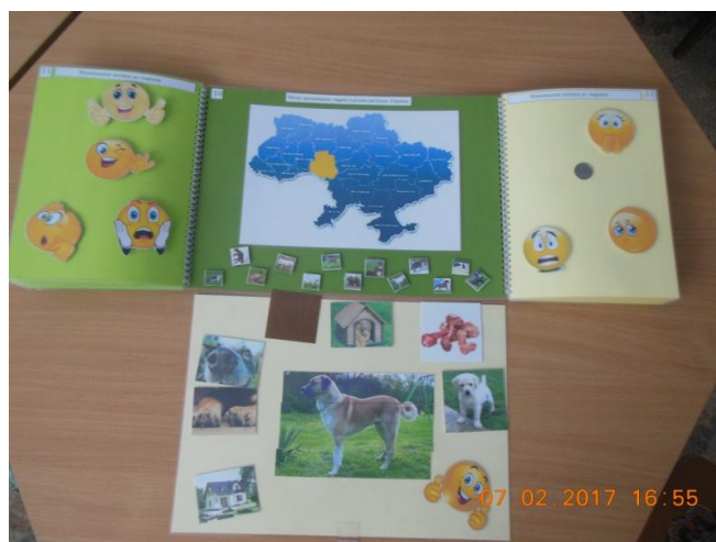
Фото 12. Розгортка 11 Визначення відношення до тварини.

Заохочувати дітей пояснювати свою думку: «Подобається, тому що...», «Я її боюсь, тому що...»