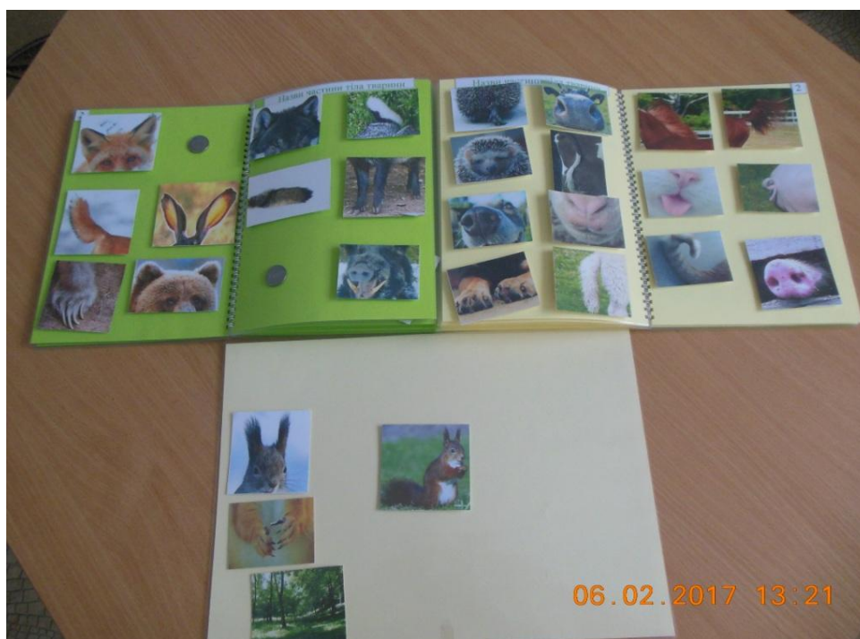
Фото 4. Розгортка 2 «Назви частини тіла тварини»