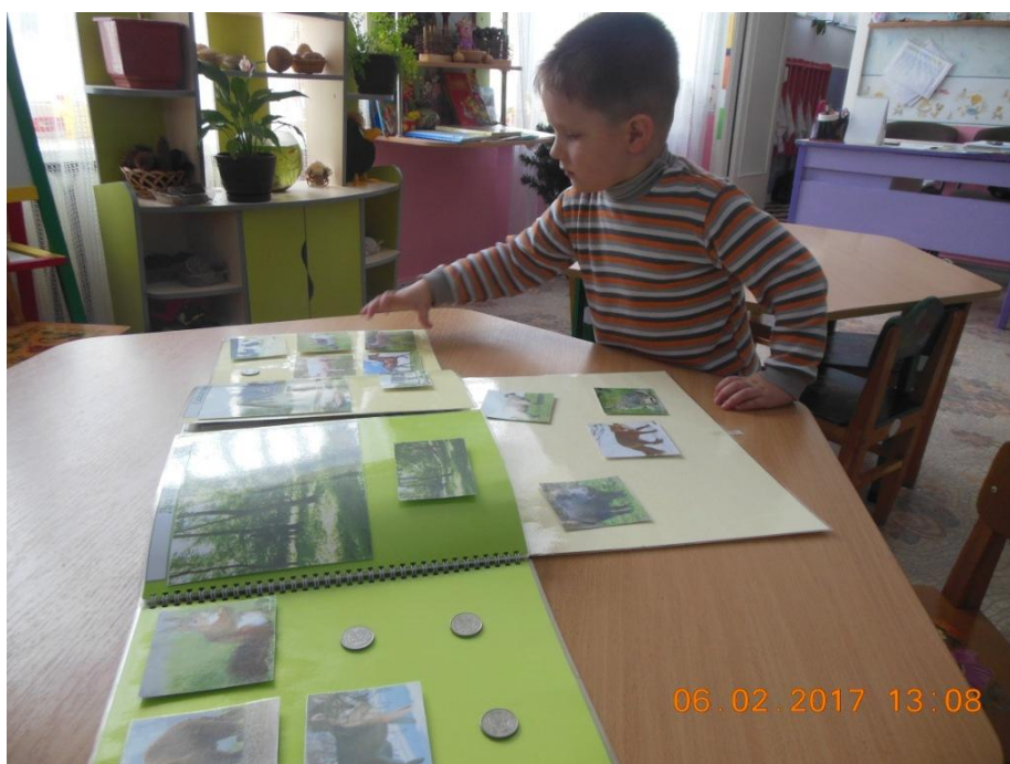
Фото 3. Дидактична гра «Дикі та свійські тварини»

Як ускладнення, запропонувати дитині пригадати, як в казках називають цих тварин (Зайчик - лапанчик, лисичка – сестричка, коза – дєреза і т.д.).