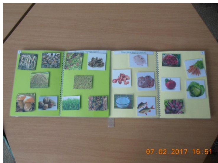
Фото 7. Розгортка 5 «Хто чим харчується?».

Дитина розглядає картки на розгортці №5 з продуктами харчування, після чого вона має розкласти ці картки біля тварин на ігровому полі і пояснити свій вибір.