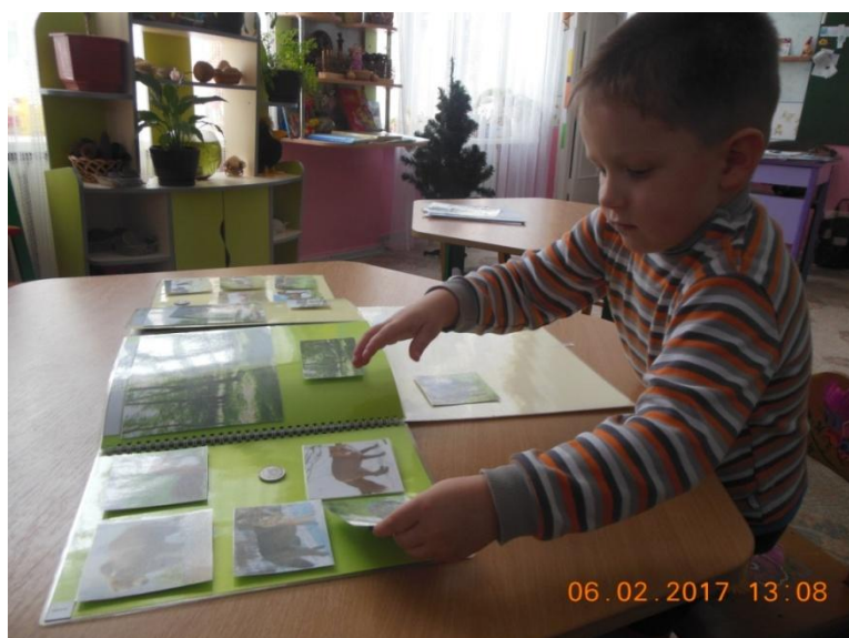
Фото 15. Процес гри дитини з посібником