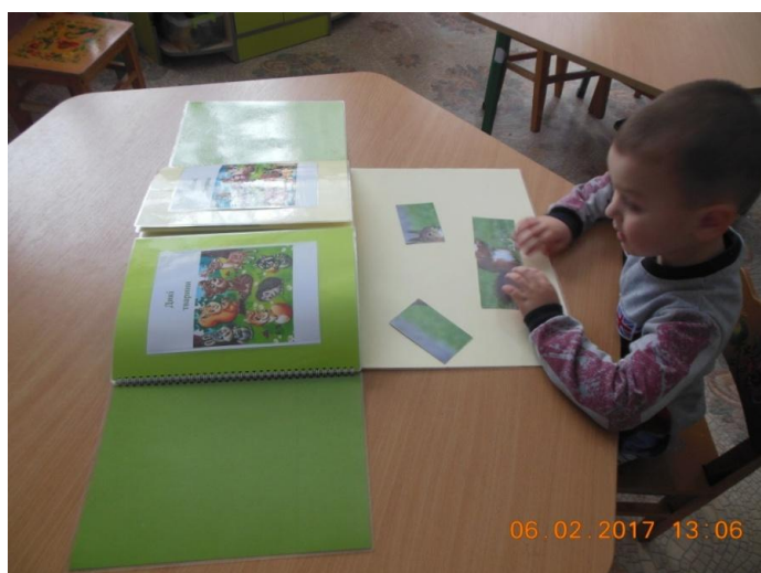
Фото 2. Робота з пазлами

Завдання ускладнюються залежно від віку та рівня розвитку дітей, завдань, які ставить педагог.