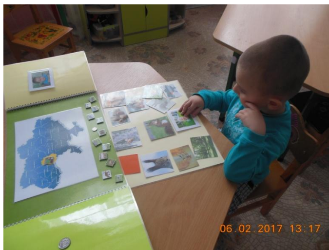
Фото 11. Розгортка 10 «Місце проживання тварини в різних регіонах України»