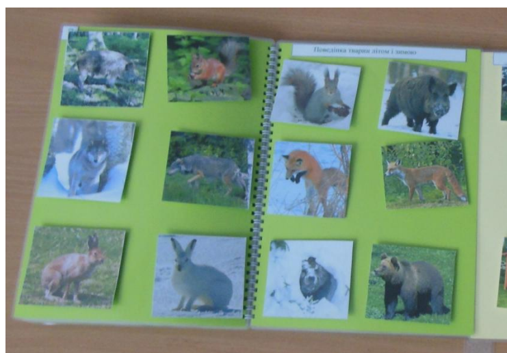
Фото 16. Особливості поведінки тварин взимку