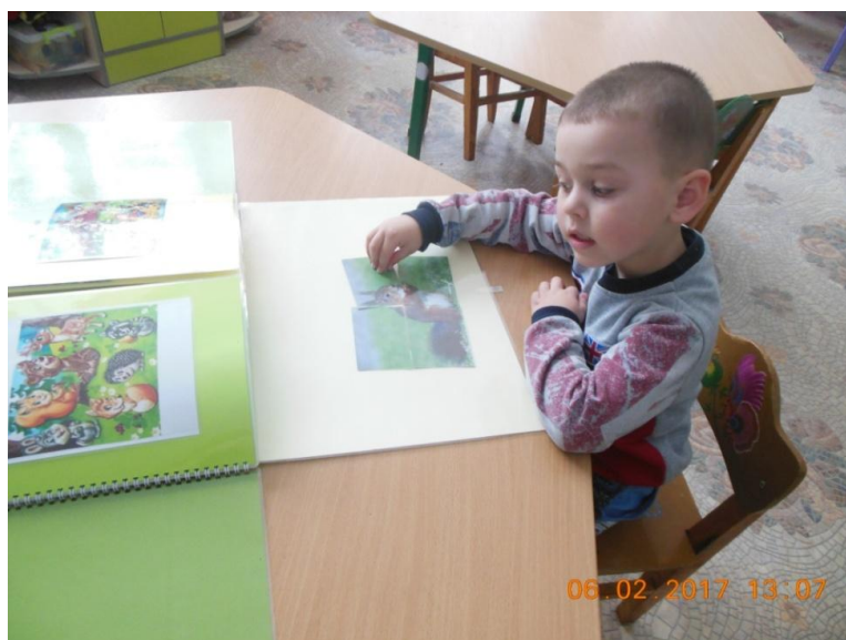
Фото 13. Дитина складає пазл на перевірку правильності відповіді на загадку

Дитина не обирає тварину яку описуватиме, а відгадує загадку, яку загадує або пропонує вихователь, потім для перевірки правильності відповіді складає пазл і лиш потім підбирає картки – підказки та викладає їх на ігровому полі, після чого складає описову розповідь.