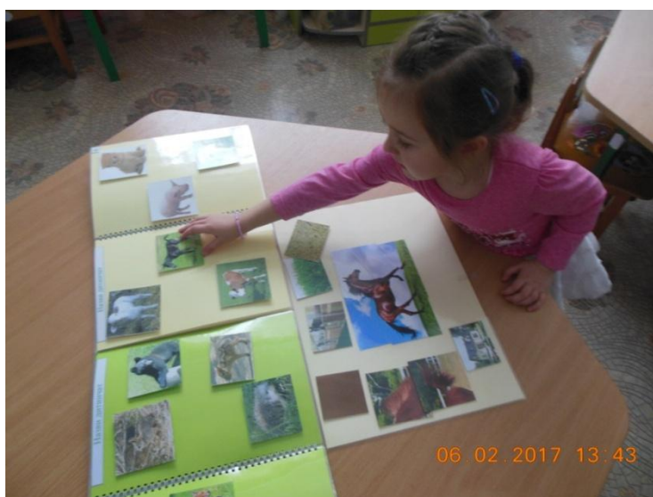
Фото 9. Робота з розгорткою 6 «Назви дитинчат».