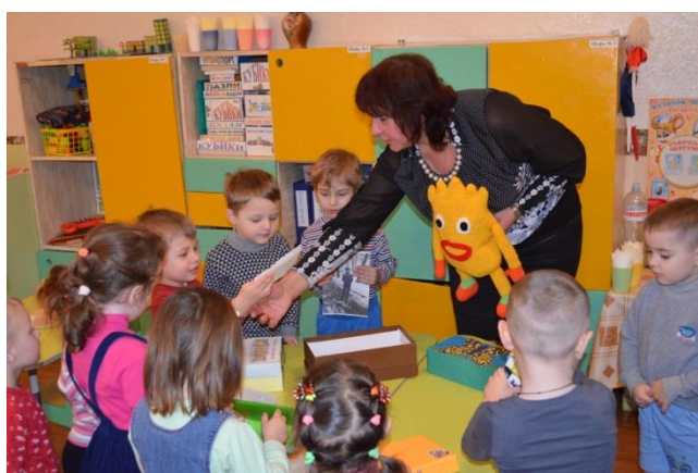
Фото 4. З коробок для подорожей з Афлатуном діти дістають ілюстрації до казок

Цікавим для дітей є завдання самостійно підібрати або скласти казку, яка ілюструє тему. Це також дає змогу виявити рівень розуміння дошкільниками особливостей і закономірностей економічних процесів і явищ.