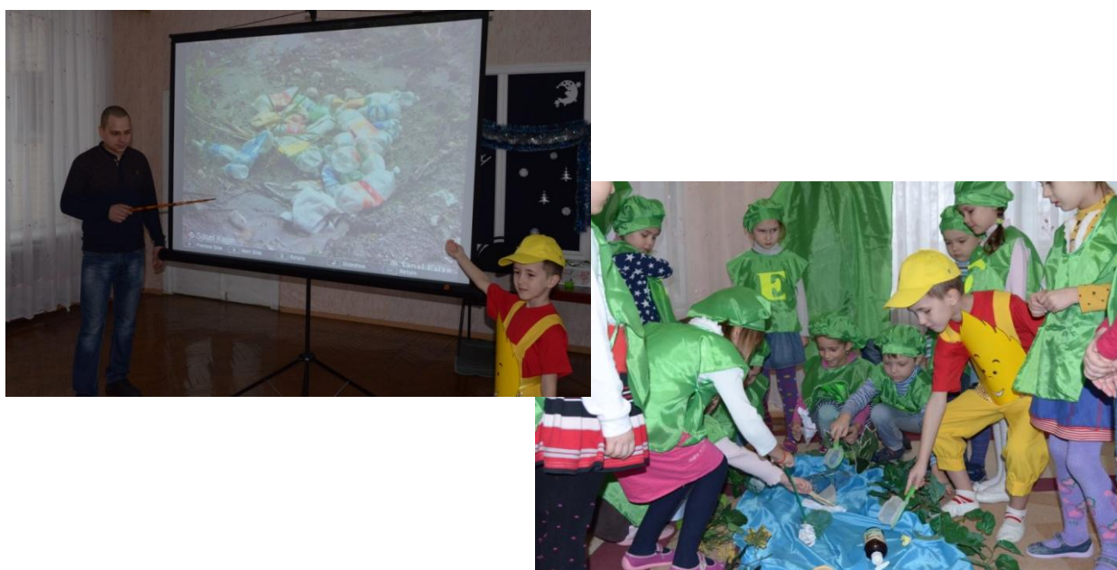
Фото 1,2. Заняття в старшій групі «Бережи воду»

Для прикладу, на заняття «Бережи воду» був запрошений фахівець-еколог, який допоміг усвідомити вагомість даної проблеми, а після презентації економічної казки «Як потрібно берегти воду» було запропоновано пограти у дидактичну гру «Друзі річки», в процесі якої діти очистили озеро від сміття та посортували його на пластик та папір.