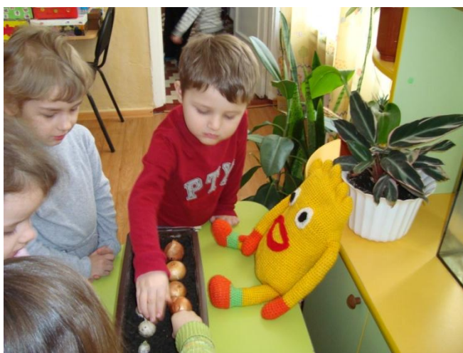
Фото 3. Привчаємось до праці з Афлатуном

Засвоїти складні економічні поняття дітям допомагають казкові персонажі. Вони мають бути частими гостями на заняттях. Справжнім другом та частим супутником малят є допитливий вогник Афлатун, який допомагає діткам опанувати матеріал. Та й самі казки просто незамінні у вихованні таких якостей особистості, як працелюбність, бережливість, практичність. З досвідом прийшло розуміння того, що майже в кожній казці можна знайти «економічний» підтекст.