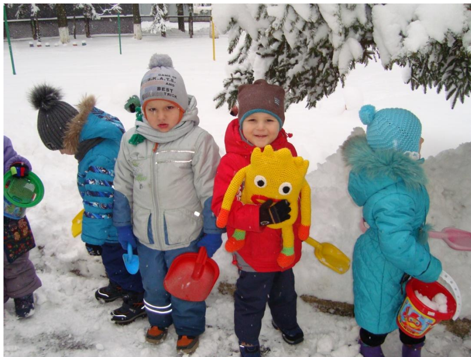
Фото 5. Праця завжди в повазі

Найбільша цінність казки звичайно в її моралі. А мораль казки – це головна думка, це те, на що націлює вона маленького слухача, які моральні цінності закладає в його душі. Так, дітям варто пояснити, що ощадливість і жадоба, скнарство – це різні речі, що праця викликає повагу, піклування про природу приносить не лише практичну користь, а і моральне задоволення від споглядання її краси.