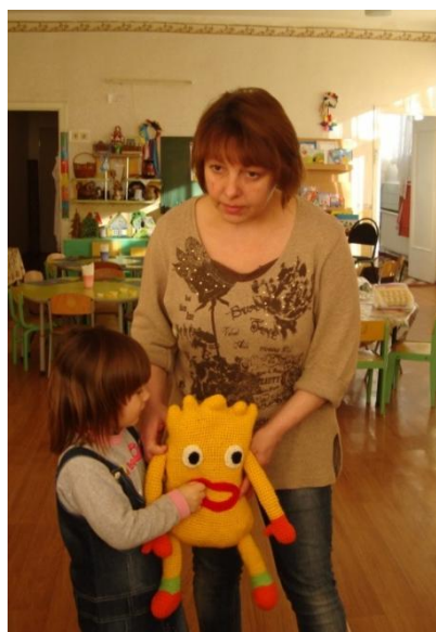
Фото 11. Зустріч з мамою-помічником вихователя

На наступному занятті з Афлатунчиком діти зліпили з кольорового тіста милко і склали його в чарівні скриньки для подорожі з Афлатунчиком.