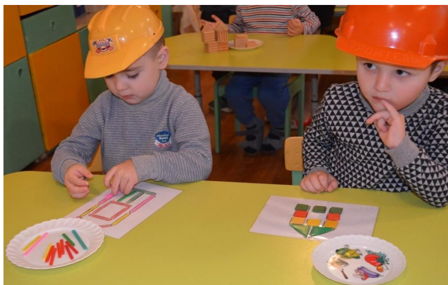
Фото 6. Будують малята новий дім звірятам (за казкою «Теремок»)