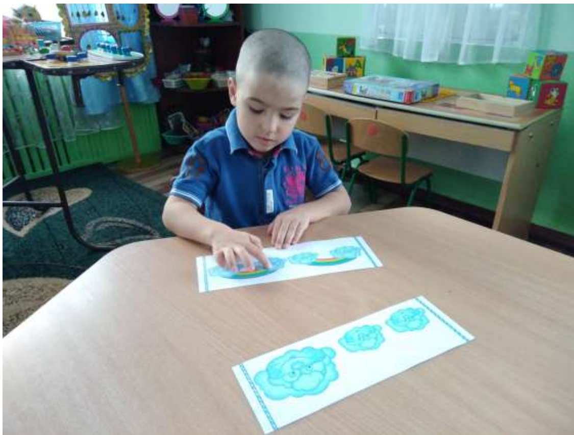
Фото 29. Гра «Хмаринки-грайлинки»

УСКЛАДНЕННЯ: відстукати за наслідуванням ізольовані удари, серію простих ударів, серію акцентованих ударів без опори на наочність (фото 28).