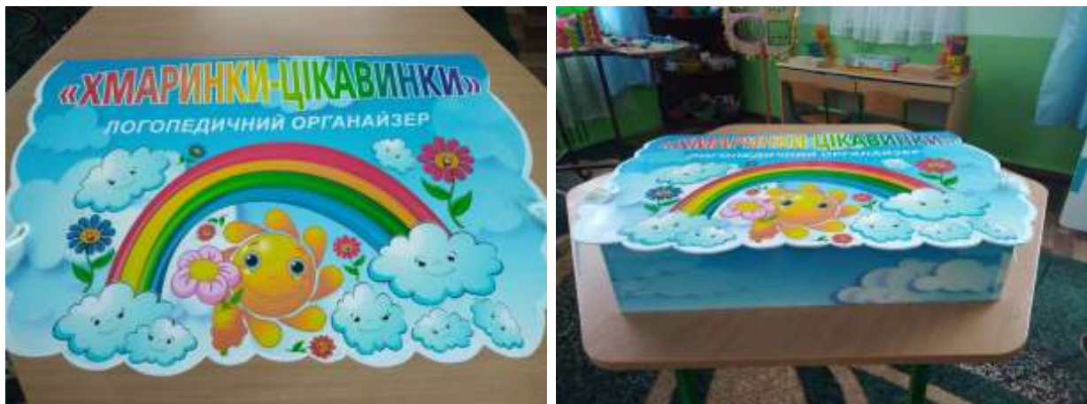
Фото 6, 7. «Логопедичний органайзер «Хмаринки-цікавинки»

Для зручності весь матеріал систематизовано та зібрано у коробку, у вигляді органайзера, та оздоблену яскравими малюнками (фото 6, 7)