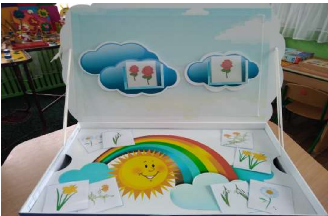
Фото 8. Відкидна кришка як демонстраційний фліпчарт

Відкидна кришка слугує демонстраційним фліпчартом та призначена для кріплення ігрових деталей за допомогою магніту (фото 8).