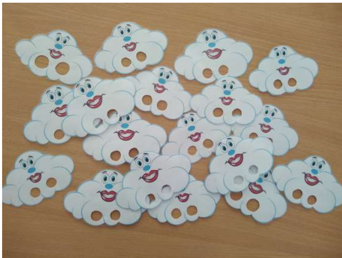
Фото 20. «Хмаринки-веселинки»