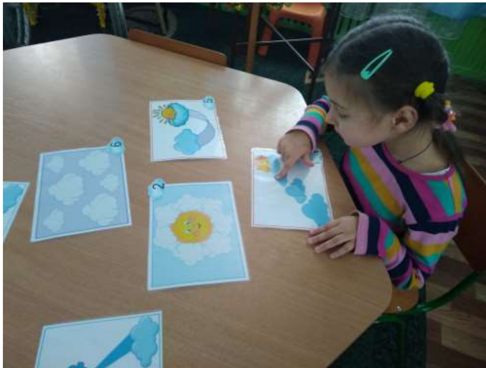
Фото 27. Гра «Хмаринкові співанки»

УСКЛАДНЕННЯ: робота в парах: немоленнева дитина виконує відповідні з кращим мовленнєвим розвитком промовляє (проспіває) голосні звуки, а немовленнева – виконує відповідні рухи (фото 27).