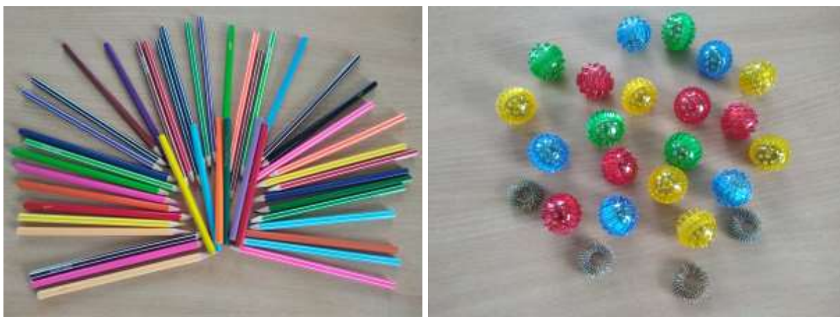
Фото 4, 5. Кульки Су-Джок та шестигранні олівці

Досить гармонійно доповнює даний комплекс використання елементів Су-Джок терапії та завдань з шестигранними олівцями (фото 4, 5).