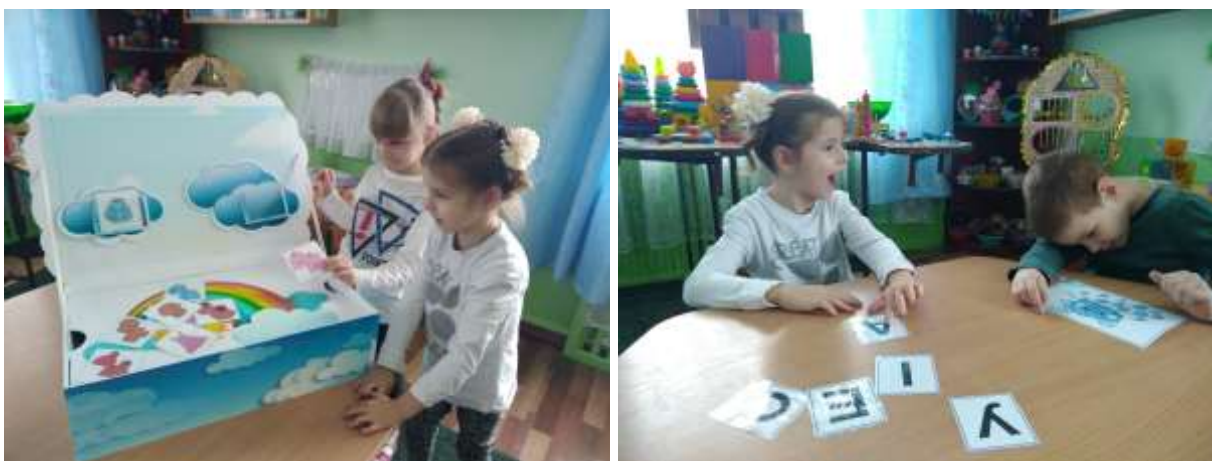
Фото 2, 3. Робота дітей в парах

В процесі проведення ігор вважаю доречним застосовувати роботу в парах, об'єднуючи дітей з різним рівнем мовленнєвого розвитку. Дитина, що розмовляє, виконує мовленнєві завдання, а немовленнєва – відповідні практичні дії, або ж промовляє (по можливості) окремі звуки, звукокомплекси, склади, прості слова. Це дозволяє вправляти дітей-логопатів у вмінні дослухатися одне до одного, контролювати власні дії та мовлення; сприяє підвищенню самооцінки та кращій мотивації (фото 2, 3).