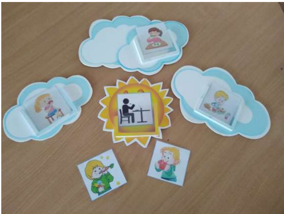
Фото 19. «Сонечко й хмаринки»