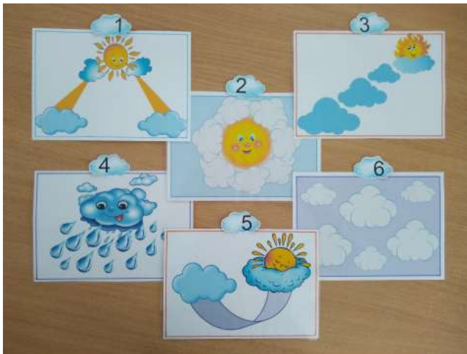
Фото 11. «Хмаринкові співанки»