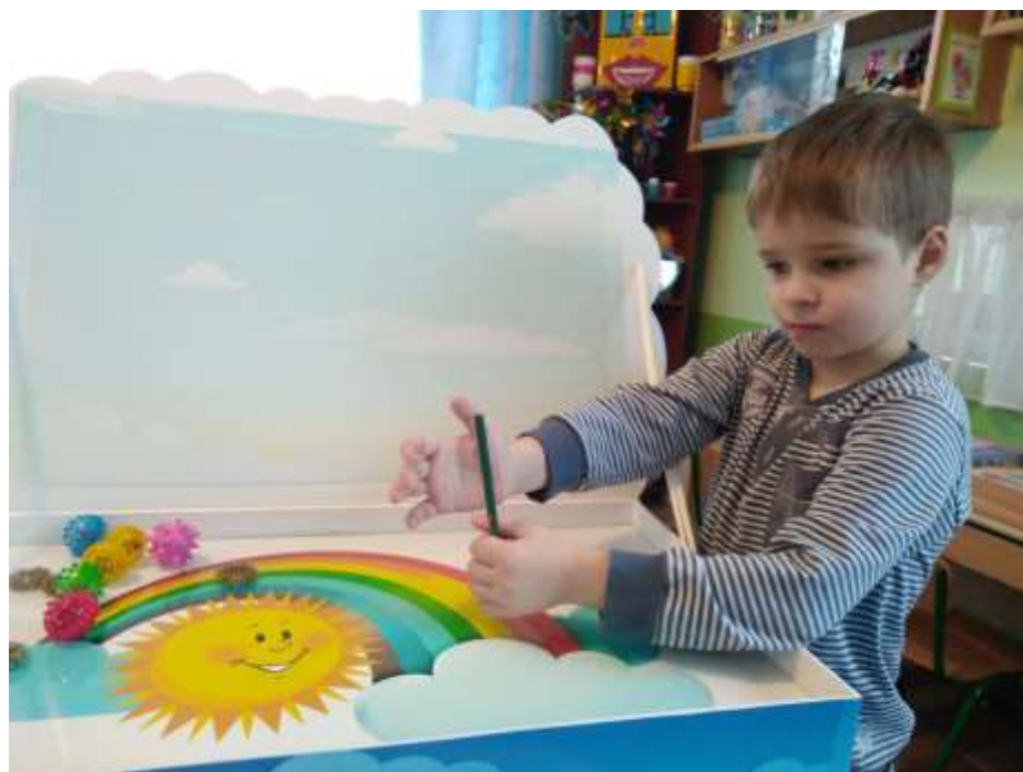
Фото 23. Вправа «Пограємо з веселкою»

(обмалювати тупим кінцем олівця долоню, що лежить на столі). (фото 23).