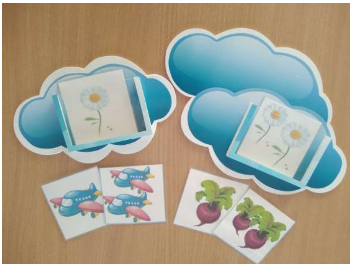
Фото 18. «Хмаринки-граматинки»