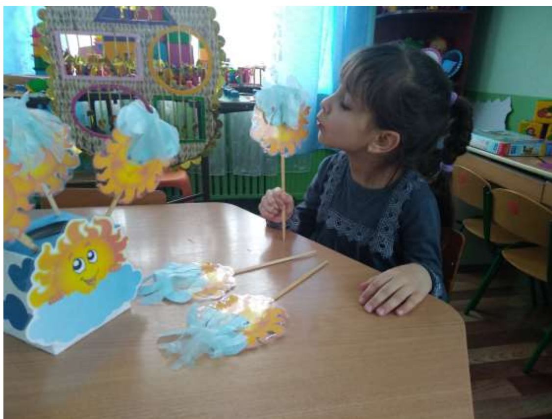
Фото 25. Гра «Летять, летять хмаринки»

Педагог створює ігрову ситуацію: хмаринки закрили сонечко і всім стало сумно. Пропонує подмухати на хмаринки аби вони відлетіли (фото 25).