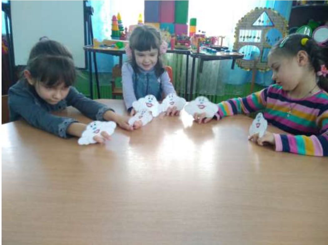
Фото 33. Гра «Хмаринки-веселинки»

Запропонований ігровий комплекс сприяє підвищенню мовленнєвої активності, подолання мовленнєвого негативізму дітей з тяжкими порушеннями мовлення. Як наслідок – покращення соціалізації дітей з особливими освітніми потребами (фото 33).