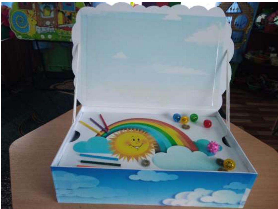
Фото 9. Ігрове поле для кульок Су-Джок та шестиграних олівців

Коробка розділена на два яруси: верхній ярус проілюстровано зображенням сонця, хмаринок та веселки. Це – ігрове поле, де «живуть» кульки Су-Джок та шестигранні олівці (фото 9).