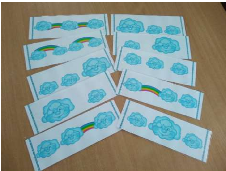
Фото 12. «Хмаринки-грайлинки»