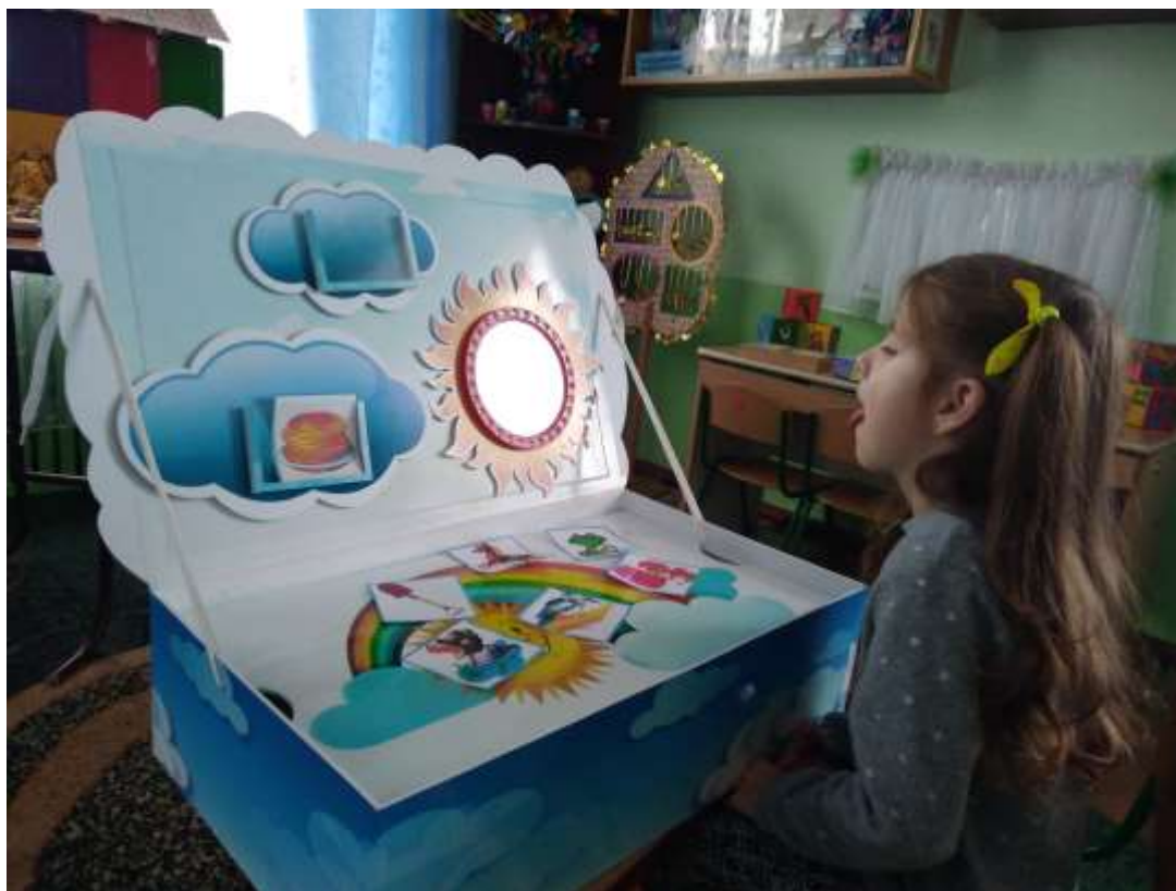
Фото 24. Вправа «Язик-дивовижний чарівник»

(розтягнути губи в усмішці – вправа «Жабка»). (фото 24)