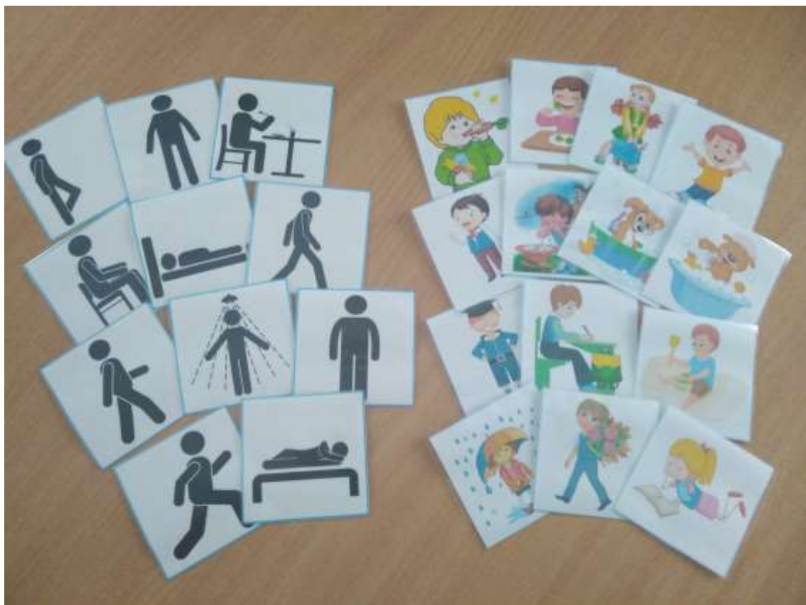
Фото 15. Картки-символи та сюжетні малюнки