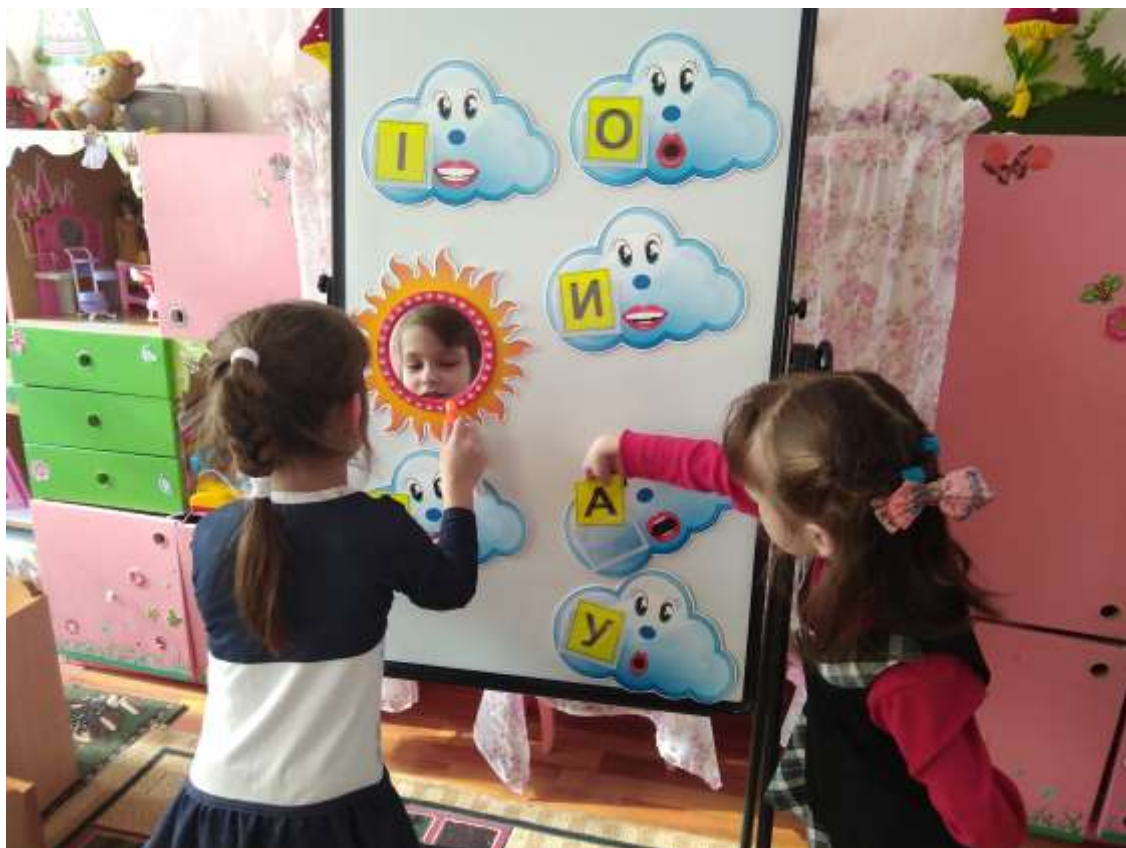
Фото 26. Гра «Хмаринки-голосинки»