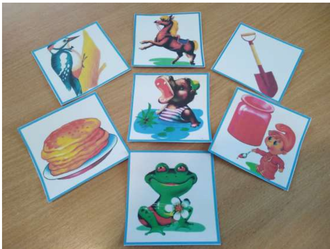
Фото 16. Картки-символи вправ артикуляційної гімнастики