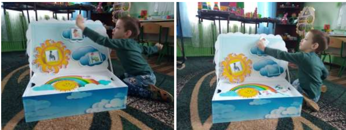
Фото 32. Гра «Сонечко й хмаринки»

УСКЛАДНЕННЯ: дібрати картки до почутого слова-дії, без опори на наочність (фото 32).