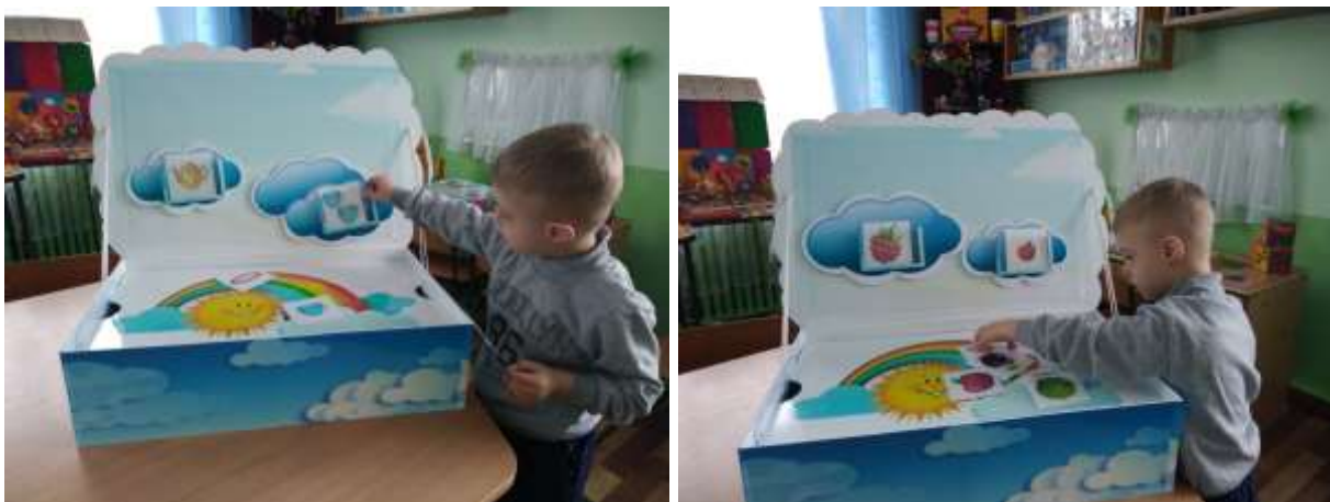
Фото 30, 31. Гра «Хмаринки-граматинки»

УСКЛАДНЕННЯ: робота в парах: мовленнєва дитина називає слово, а не мовленнєва – обирає потрібну катку та викладає її у кишеньку відповідної хмаринки (фото 30, 31).