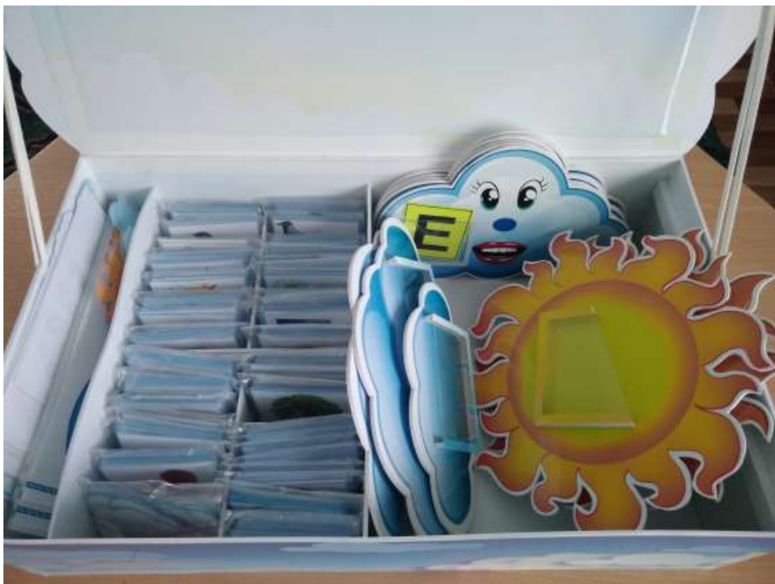
Фото 10. Наочний матеріал для проведення ігор та вправ