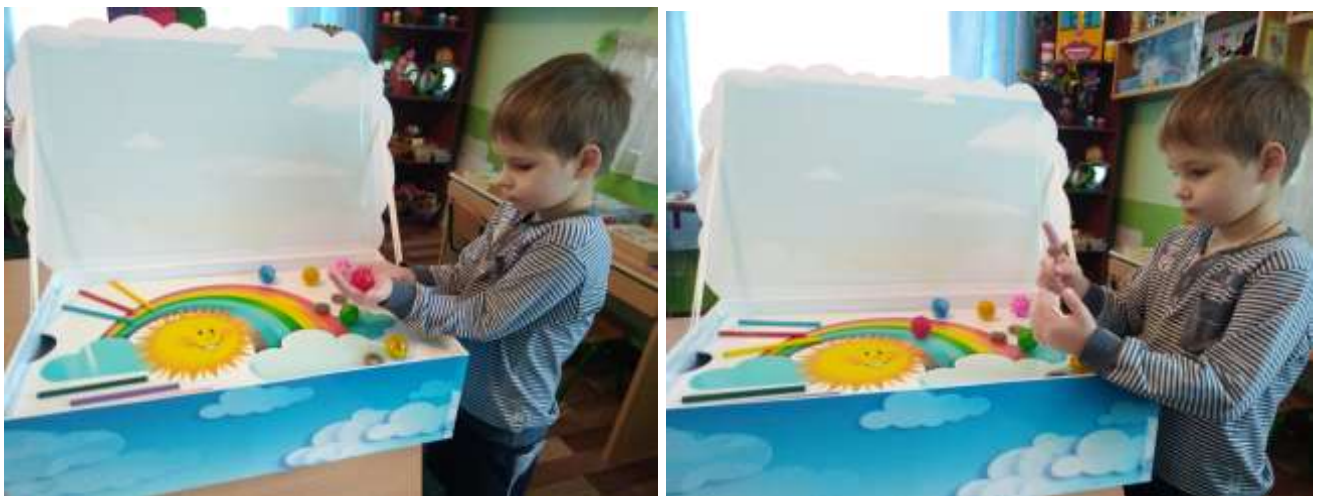
Фото 21, 22. «Історії від сонечка»

(прокотити вздовж пальців пружинне кільце, спочатку на правій потім на лівій руці, починаючи з великого пальця). (фото 21, 22).