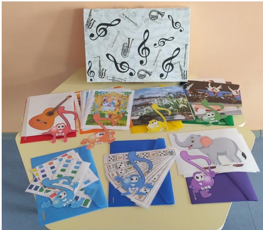
Фото 4. Папки із завданнями