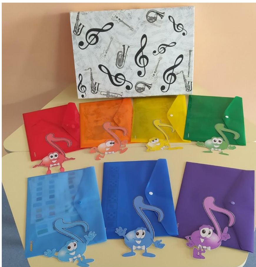
Фото 5. Кольорові папки з нотами