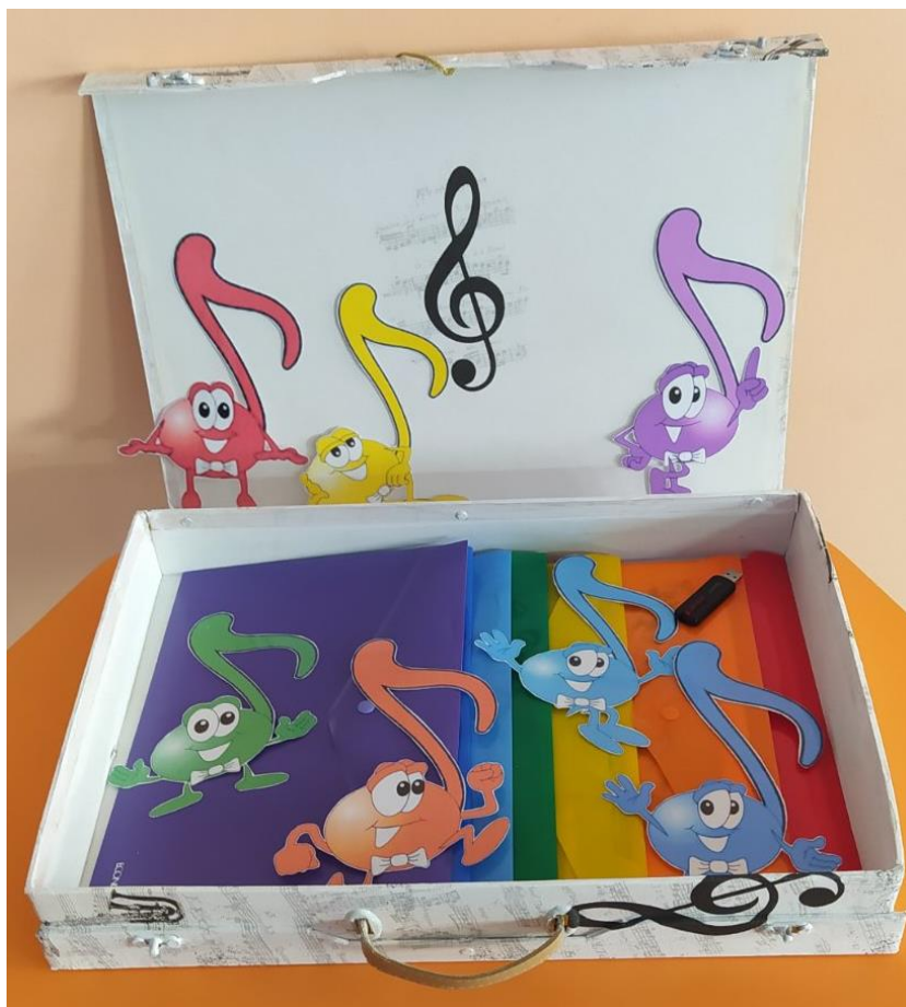
Фото 3. Валіза завдань