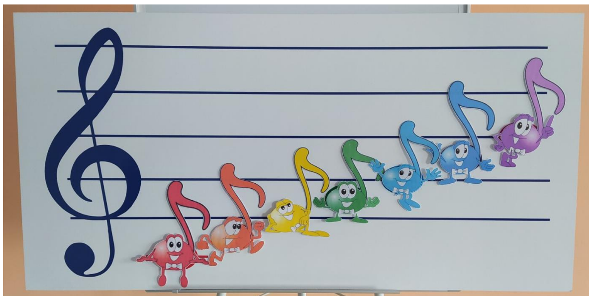
Фото 6. Нотний стан з нотами

Виконавши перше завдання, діти отримують ноту та повертають її на нотний стан відповідно до кольору, після чого учасники отримують наступне, і так триває до тих пір, поки не пройдуть увесь маршрут. В кінці гри усі ноти розкладені на свої місця (Фото 6).