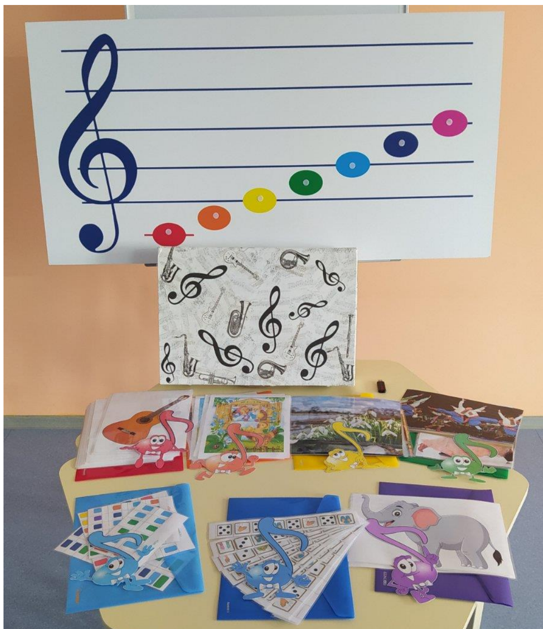
Фото 1. Дидактична гра «Музична валіза»